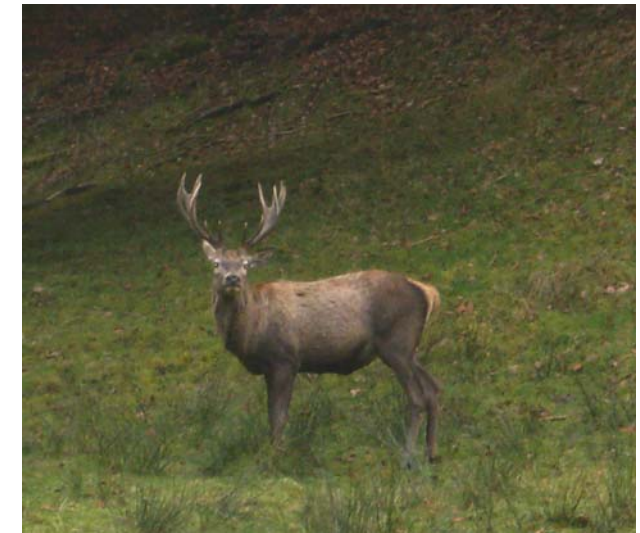
Rotwild im Zeller Wildgehege